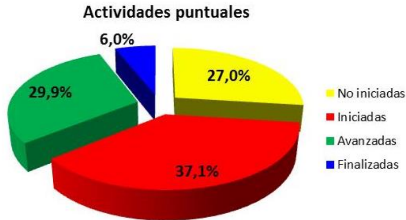
Figura 2: Grado de avance en la ejecución de las actividades puntuales